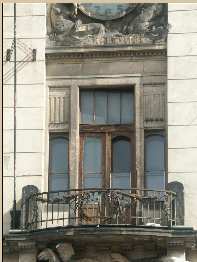
střední část zábradlí