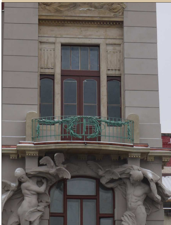
celkový pohled v roce 2016